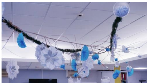
LES ATELIERS CREATIFS POUR UNE DECORATION D'HIVER