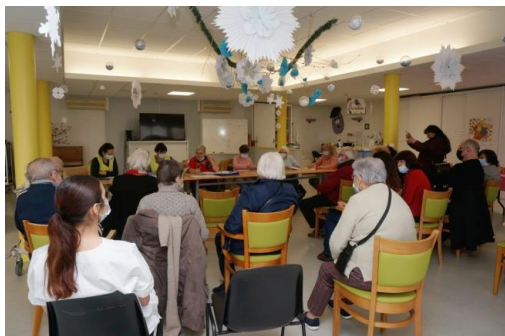
AG BVST A L'EHPAD DU 12 FEVRIER AVEC FEVRIER 2024 PRESSE C.F. JOURNAL DEPECHE DU 28 FEVRIER 2024